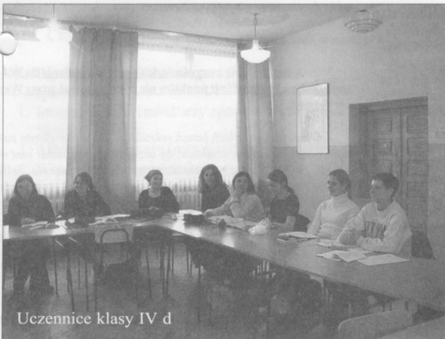
Uczennice klasy IV d

Wywiad przeprowadziła: M. Filip