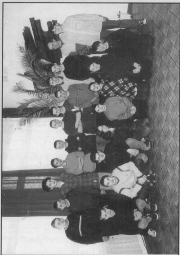
III c Gimnazjum we Frysztań