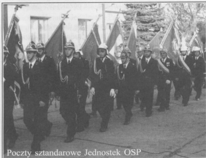
Poczty sztandarowe Jednostek OSP