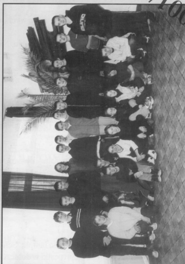
III d Gimnazjum we Frysztań