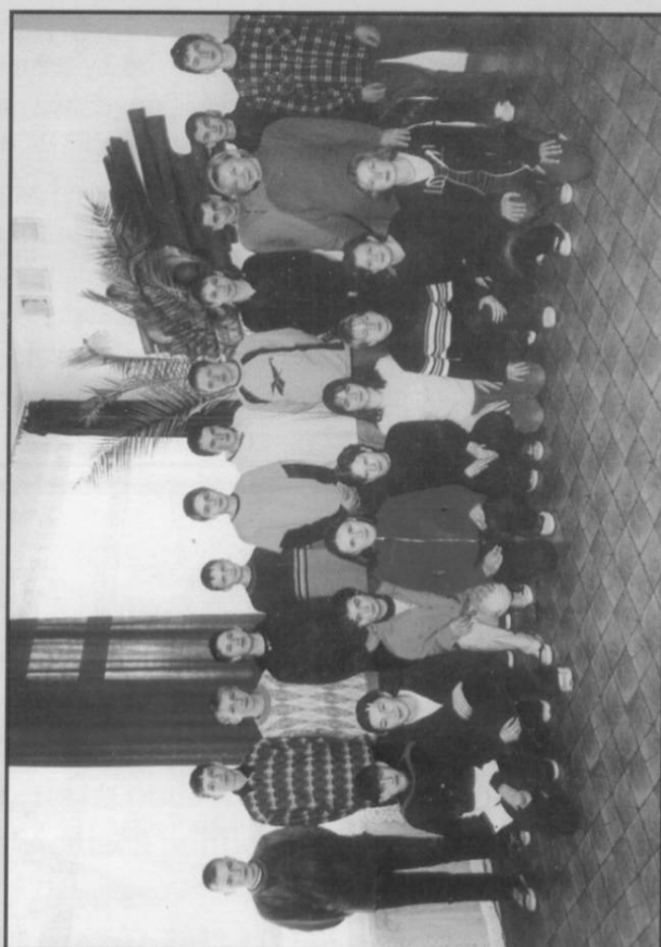
III b Gimnazjum we Frysztań