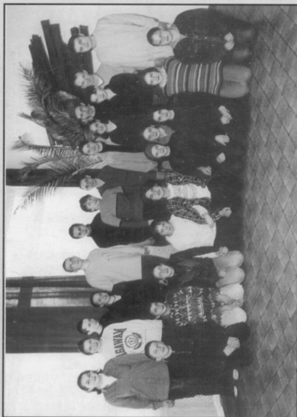
III e Gimnazjum we Frysztań