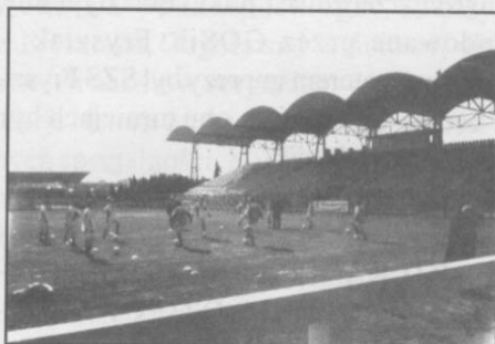
Zajęcia konferencyjne na stadionie piłkarskim KSZO – Ostrowiec Świętokrzyski