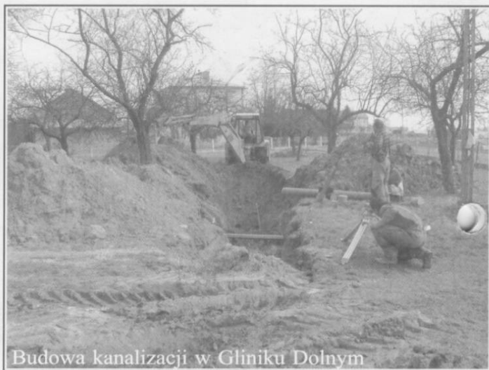
Budowa kanalizacji w Gliniku Dolnym