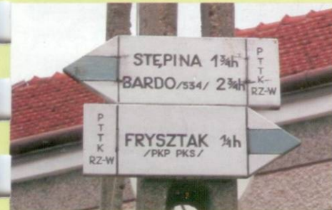
Opis pieszych szlaków turystycznych w gminie Frysztań