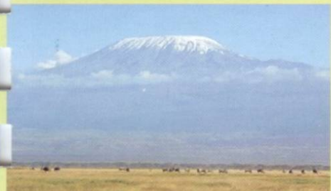
„...z Frysztań na Kilimandżaro...” relacja mieszkańca Frysztań z jego wyprawy na najwyższy szczyt Afryki.