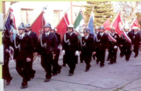
3 Maj - Uroczystości z okazji Dnia Strażaka