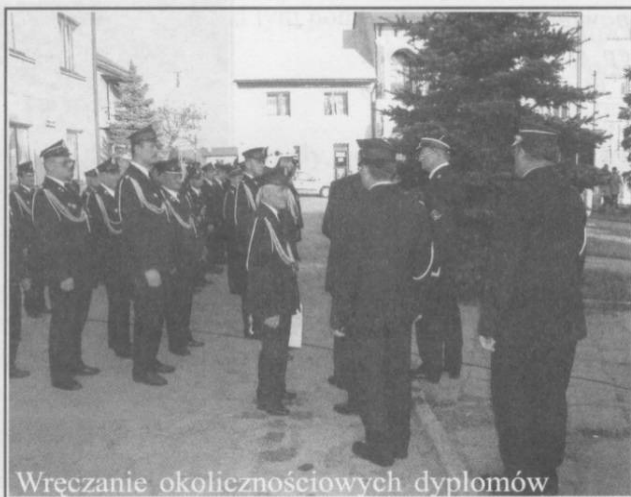
Wręczenie okolicznościowych dyplomów