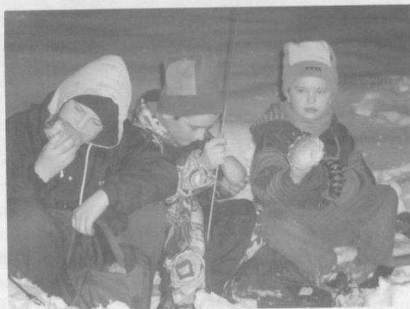
Strudzeni wędrowcy regenerują siły...