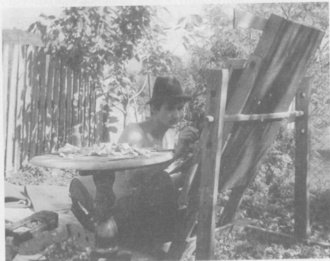
Artysta podczas pracy