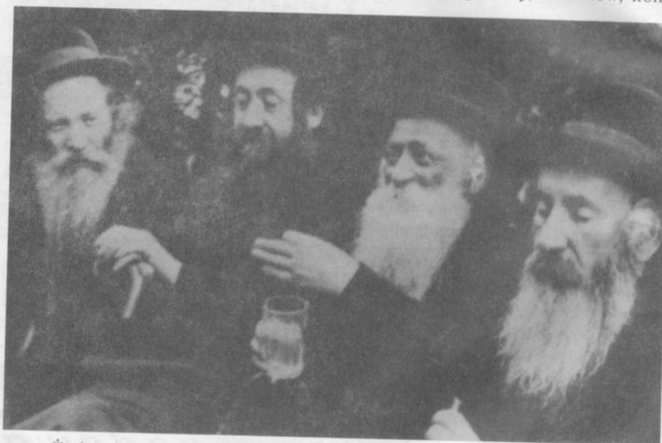
Żydzi okresu międzywojennego

rozwoju spółdzielczości wśród Polaków). Jak wielką przewagę stanowiła w miasteczku społeczność żydowska wskazują następne dane. Otóż w Ilustrowanym Przewodniku po Galicji, który powstawał w latach 1906 – 1914, dr Mieczysław Orłowicz podaje liczbę mieszkańców Frysztaka na 1500 mieszkańców, z czego 1100 to ludność izraelska. Wśród zajęć i zawodów społeczeństwa żydowskiego w 1923 roku pojawiają się min.: adwokat, aptekarz, lekarze, akuszerki, blacharze, szklarze, szewcy, siodlarze, kowale, sprzedaż i handel nierogaczyny, bławatów, koni,