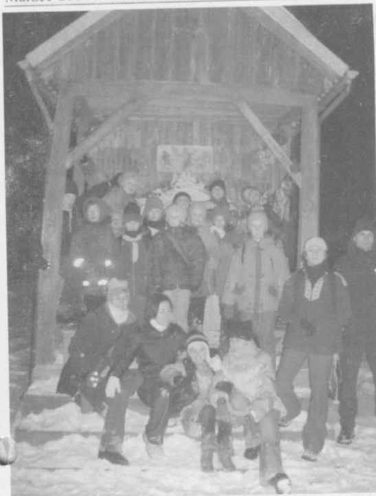
Zdobywcy w całej okazałości