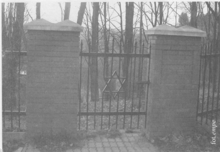
Brama wejściowa na frysztacki kirkut.

czyli prawa majątkowe Żydów oraz prawo do swobodnego przemieszczania się i zmiany miejsca pobytu. Zabroniono także posługiwania się językiem hebrajskim. Działał Judenrat, czyli namiastka samorządu żydowskiego, kontrolowany całkowicie przez Niemców. Rada ta, stała się narzędziem w ręku okupantów, którzy czynili wszystko, aby zniszczyć Żydów ekonomicznie i fizycznie. Judenrat zajmował się głównie dostarczaniem taniej siły roboczej dla Niemców. Funkcjonowała również żydowska policja, aby sprawnie egzekwować niemieckie podatki nałożone na całą społeczność