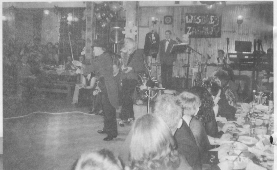
Pokaz sztuk magicznych